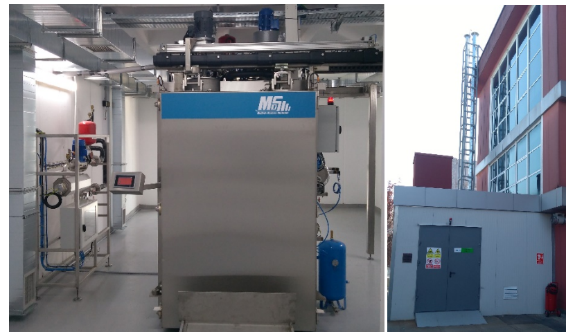
New ETO Sterilization System with Scrubber Unit for waste gas scavenging and recycling.